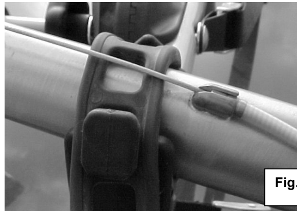
Fig. 4 Like this!

6. Attach the rubber straps (total 4) to the rubber cradles. Start with the round (end) hole of the strap stretched over the diamond shaped "nub" on the cradle. Which hole you choose for the other "nub" will depend on the diameter of the bicycle's specific tube placed in the cradle. Each strap should snuggle firmly and completely over the "nub." Check to make certain that all straps are attached correctly before proceeding. Be sure not to route straps over any cables (see Fig. 3 .), but rather under them (see Fig. 4 ). This will protect the finish on the bicycle frame and provide a more solid mounting on the Express rack.