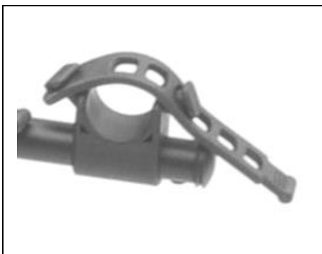
Fig. 3: Bike Cradle