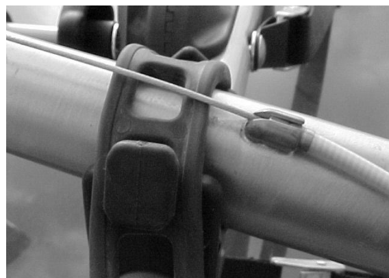
Fig. 4: Wrap rubber straps under cables